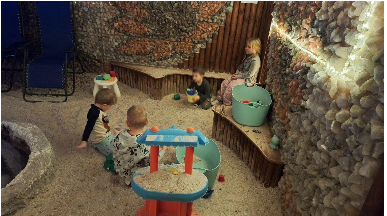
Kolektiv MŠ Kpt. Jaroše