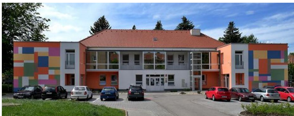
Mgr. Lenka Novotná ředitelka školy

Těšíme se na všechny nové děti, které se možná již brzy stanou součástí naší školkové rodiny.